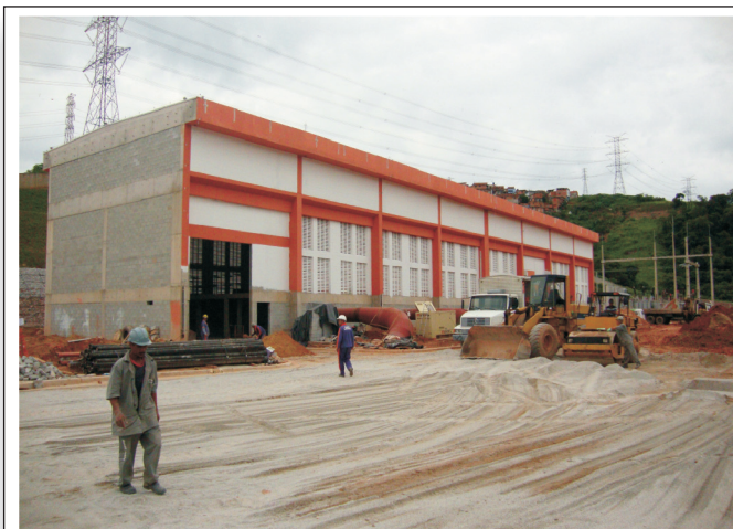
Vista Externa da Estação Elevatória