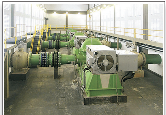
Vista Interna da Estação Elevatória